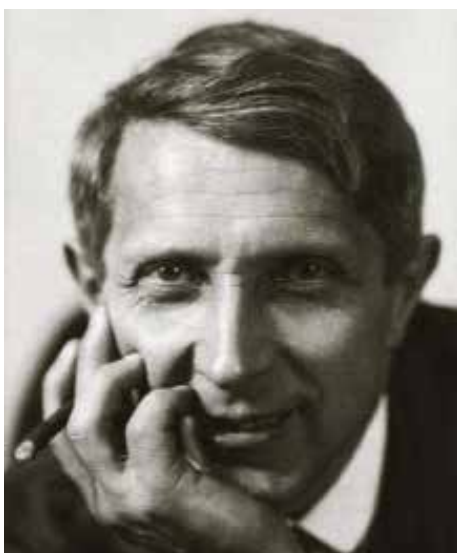
FRANTIŠEK DRTIKOL: BROMOGRAFIE V GALERII JOSEFA SUDKA