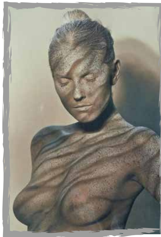
Autor - Jaromír Komenda