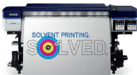
S60600 | production 2 x 4-color