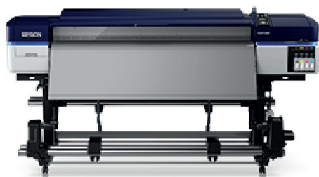
S40600 | entry level 4-color